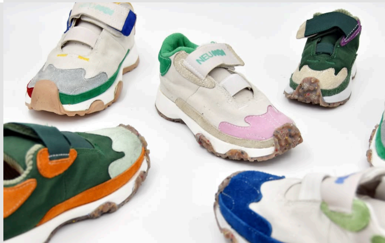
Narada Zürer, NEUNOI ( 2024—BA Industrial Design )