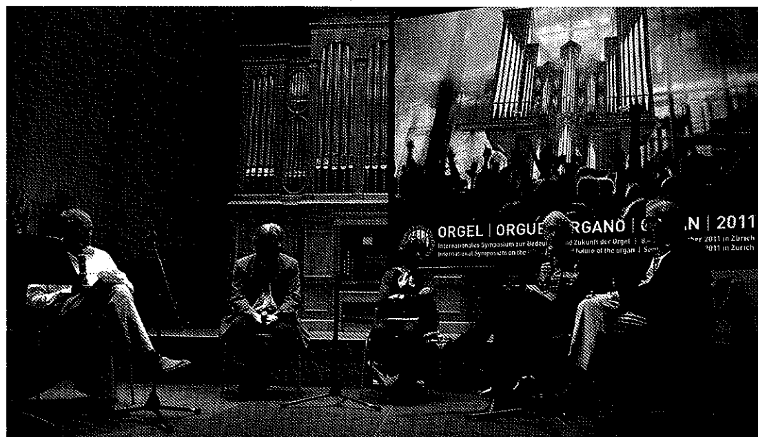
Ci-dessus : l'une des tables rondes du colloque. Ci-contre : quelques étudiants à la tribune de Stade, dans le cadre du Jugend Orgelforum en juillet 2011.